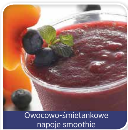
Owocowo-śmietankowe napoje smoothie